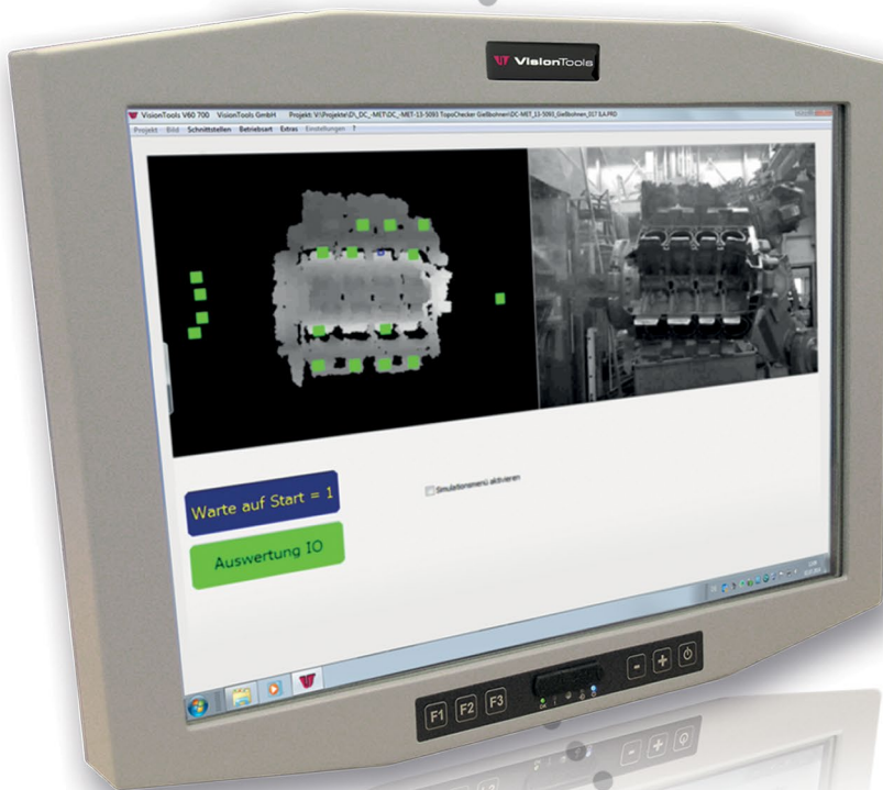
Slybox V - TP-15, 15" Touchpanel

LED-Beleuchtung z.B. Modulleuchte ML-300